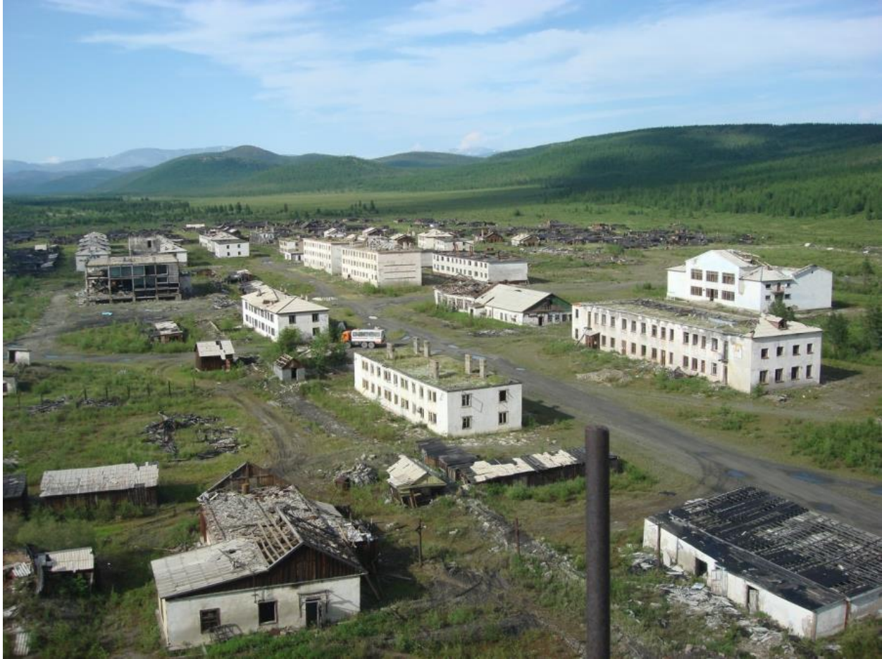
Աքտրաօկայրս այսօր՝ ավան-ուրվական:

Երիտասարդ աշխատակցի ողբերգական մահը ՊԱԿ-ում ինչ որ բան էր փոխել: Նրանք երեւի վճռել էին, որ ես եմ կազմակերպել Վադիմի հրաժարումը եւ զանգր: Մի քանի օրից միլիցիոներն ասաց, որ ինձ ՊԱԿ են կանչում: Գնացի: Այնտեղ ինձ պաշտոնապես տեղեկացրին, որ ես ավանի բնակիչների շրջանում հակախորհրդային ազիտացիա-պրոպագանդայով եմ զբաղվում, որ «ազդում եմ» մարդկանց վրա, իսկ թե ինչպես եմ ազդում՝ չասացին: Փոխարենը խոստացան, որ այսուհետ խիստ են լինելու, եւ իմ յուրաքանչյուր քայլը փաստաթղթավորվելու է: Հասկացա. առջեւում բարդություններ են սպասվում: