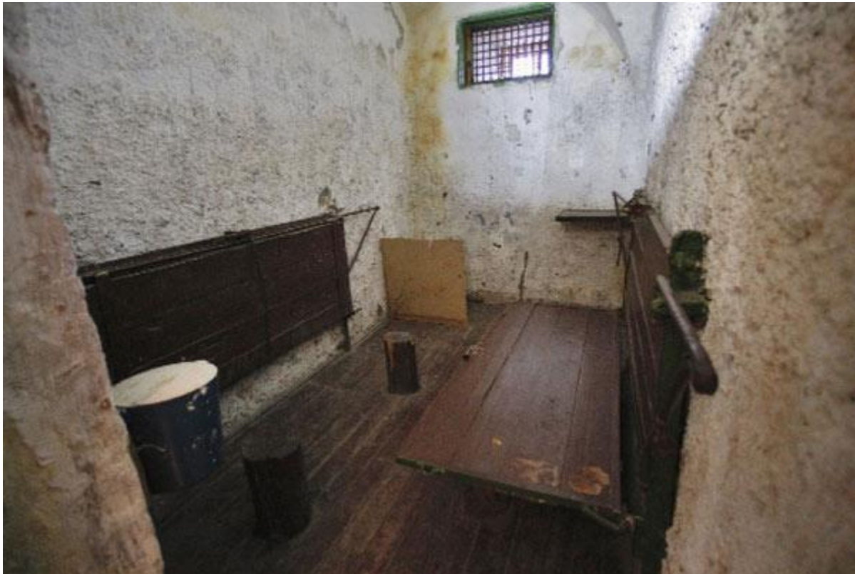
Պատժիչ մեկուսարանի երկտեղանոց խուց

գաղութներում եւ, բնականաբար, այդ գաղութների պատժիչ մեկուսարաններում. ամենացուրտ ու ամենաանմարդկային պատժիչ մեկուսարանը 37-րդ գաղութին էր: Այստեղ շատ ցուրտ էր, չկար ոչ զուգարան եւ ոչ էլ լվացարան: Լվացվելու համար խուց-լվացարան էին տանում, իսկ արտաքնոցը պատժիչ մեկուսարանի բակում գտնվող փայտաշեն կառույցն էր, ուր տանում էին օրական մեկ անգամ: Խիստ անհրաժեշտության դեպքում հատուկ տարա էին տալիս, որը մի 40-50 սմ բարձրությամբ մետաղյա ժանգոտած տակառ էր երկու բռնակով ու կափարիչով: Աշնան սկզբից մինչեւ գարնան վերջը ցրտի պատճառով այստեղ նստելն էլ ավելի անտանելի էր դառնում: Տարվա ցուրտ եղանակին պատժիչ մեկուսարանը ջեռուցվում էր: Ըստ օրենքով սահմանված համապատասխան պահանջների, խցում ջերմաստիճանը չպետք է 18 աստիճանից ցածր լիներ, բայց իրականում 15-16-ը չէր գերազանցում: Անգամ, եթէ հրաշքով պահանջվող 18 աստիճանն էլ ապահովվեր, միեւնոյն է, սոված ու հյուծված լինելու պատճառով մարդիկ մրսելու էին: 37-ի պատժիչ մեկուսարանի անմարդկային պայմաններին ժամանակին իր 52-րդ թողարկման մեջ անդրադարձել է «Խրոնիկան»: