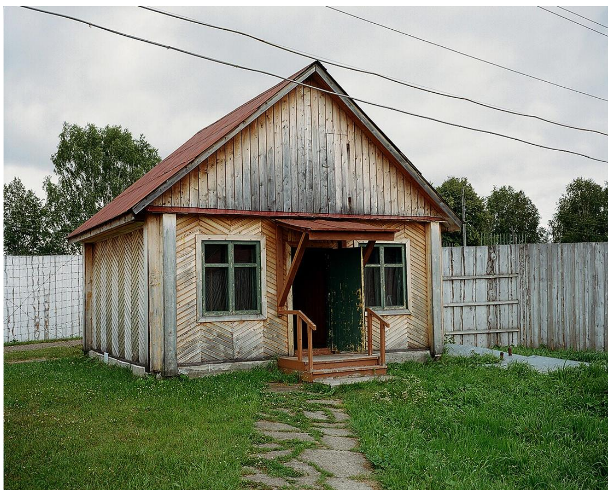
«Шмоналовка» 36-ой зоны

Нас привели на обеденный перерыв из трудовой зоны в жилую, а после обеда должны были вернуть обратно. На трудовую зону мы попадали через контрольно-пропускной пункт, который зеки называют «шмоналовкой», поскольку там нас обыскивали, как при входе, так и при выходе. «Шмон» - обыск на блатном жаргоне.