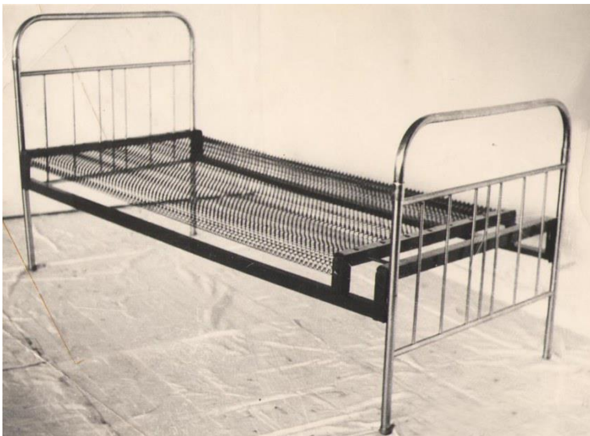
Кровать в бараке

Но каково же было мое удивление, когда после карантина охранник вывел меня из камеры и повел по территории зоны к бараку. Прежде всего меня впечатлила сама территория. Она была не очень большой, но аккуратной и в полной мере просторной для прогулок. Барак удивил меня еще больше. Это было просторное, опрятное, залитое проникающим сквозь широкие окна солнечным светом помещение, в котором в три ряда стояли железные кровати (их было примерно 30), и они были вовсе не такие, на которых приходилось спать в пересылках, а мягкие, с пружинами.