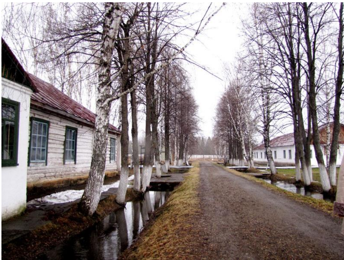
Аллея 36-ой зоны

Новая моя зона существенным образом отличалась от всех предыдущих. Прежде всего, территория этой зоны была намного больше. На территории 36-го лагеря было довольно много строений: отдельная баня, отдельный медпункт, отдельная столовая и так далее. Она отдаленно напоминала, возможно, 35-ю зону, но не могло быть никакого сравнения с первой моей зоной - 37-й. Там была металлообрабатывающая, столярная мастерская, был небольшой цех, в котором изготавливались детали и электрические провода для утюгов. Сама зона находилась на берегу реки Чусовая, поэтому весной там часто случались большие и малые наводнения. Кроме того, в этой зоне было значительно больше людей. И еще одно важное обстоятельство: в жилой зоне существовала самая настоящая аллея из деревьев. Я уже писал о том, что деревья были и в 35-й зоне, но они были отделены от территории зоны колючей проволокой, ими можно было любоваться, прогуливаться рядом, но находиться непосредственно под ними было невозможно. А здесь можно было пройти по аллее до столовой, или медпункта. Мы с удовольствием прогуливались по этой аллее.