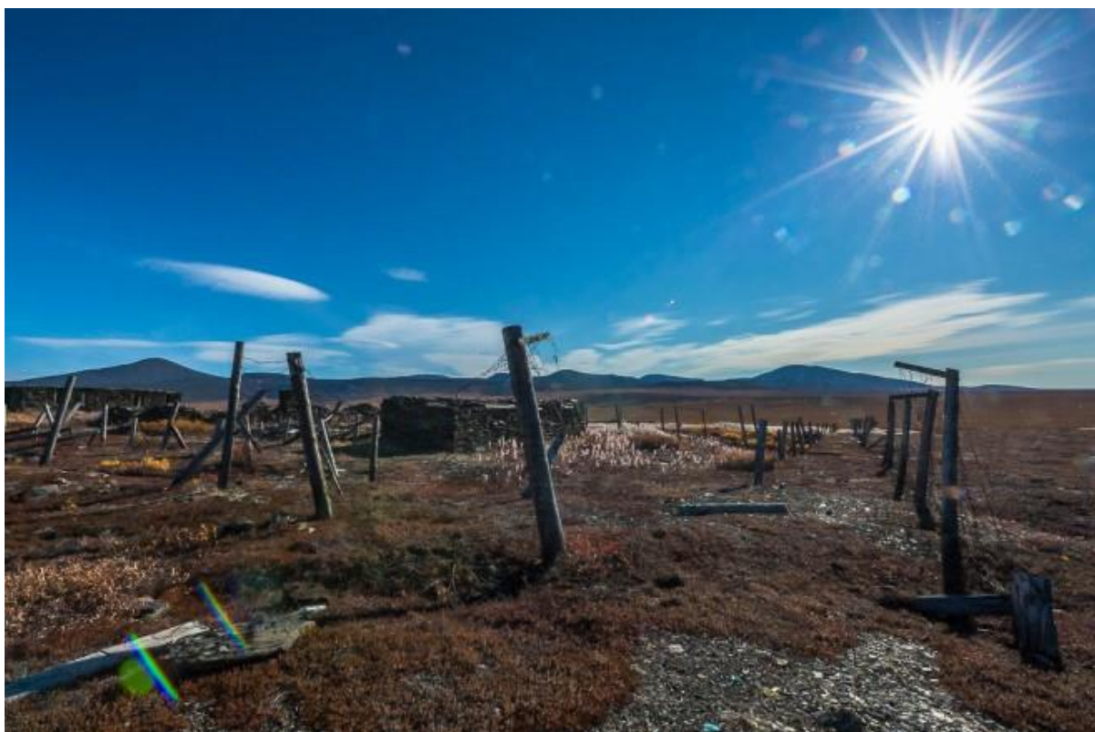
Заброшенная зона в Магаданской области