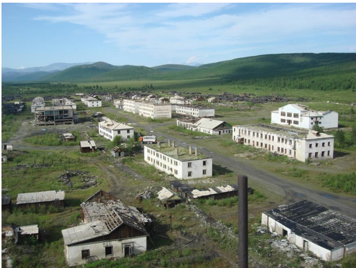
Пос. Буркандья, место моей ссылки. Сегодня там никто не живет, поселок-призрак.