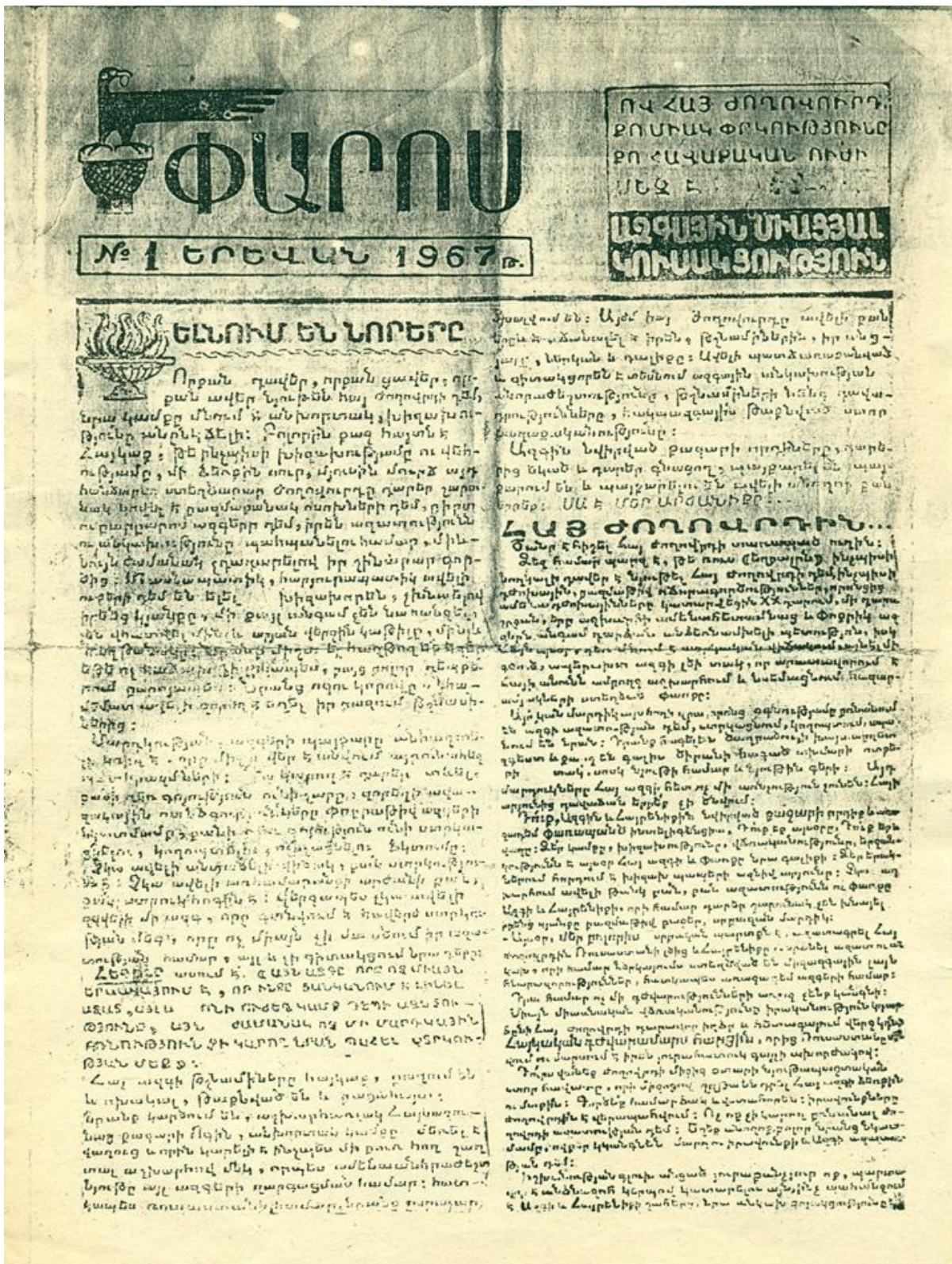
Первая страница газеты «Парос» (Маяк)

обретения независимости эта группа относилась с осторожностью, всячески избегая конкретики в формулировках. Лишь во второй половине 1970-х, опять же, после ареста и освобождения представители этой организации окончательно созрели и поддержали идею независимости.