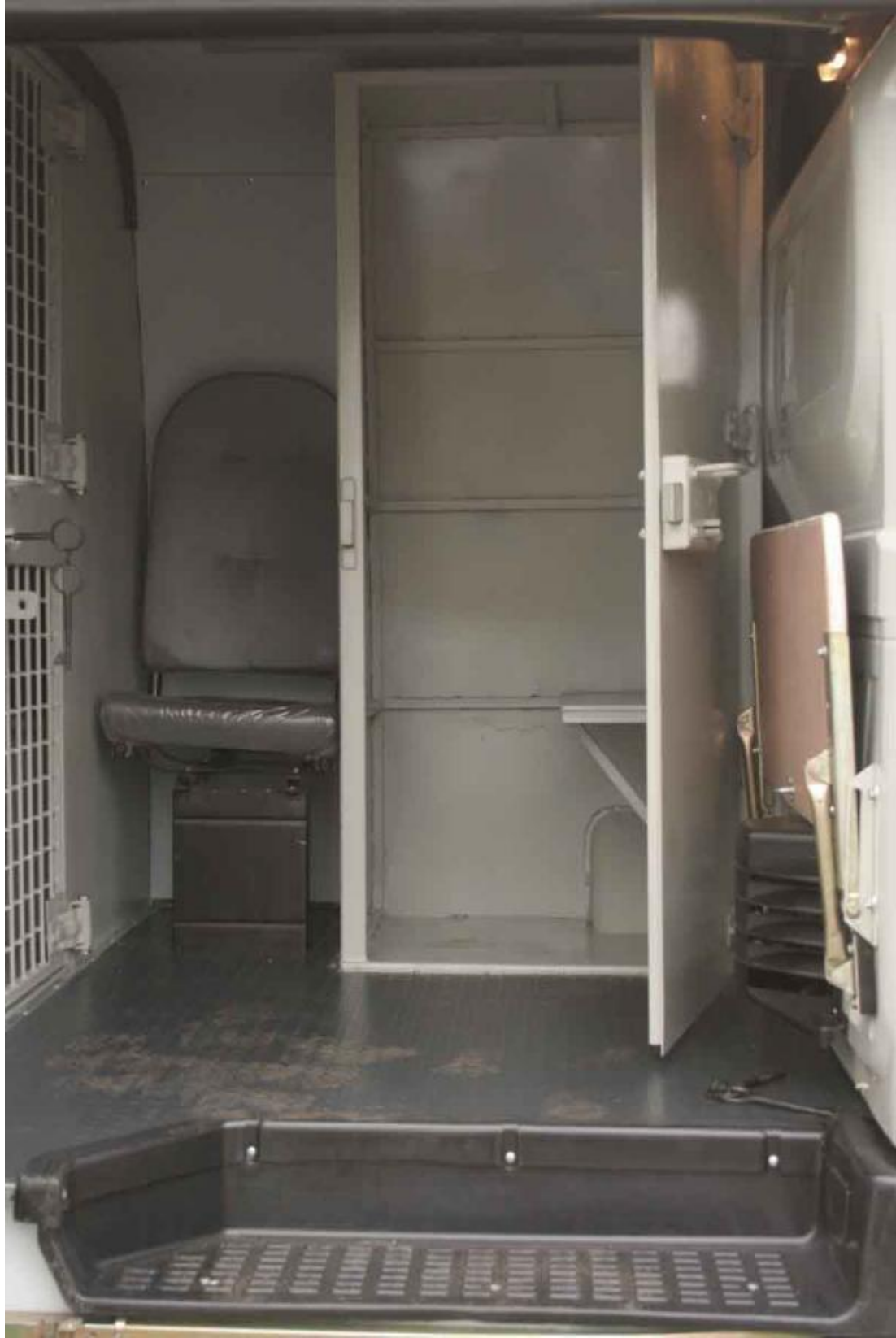
Մեկ տեղանոց խուց «սեւ ագրափուս»