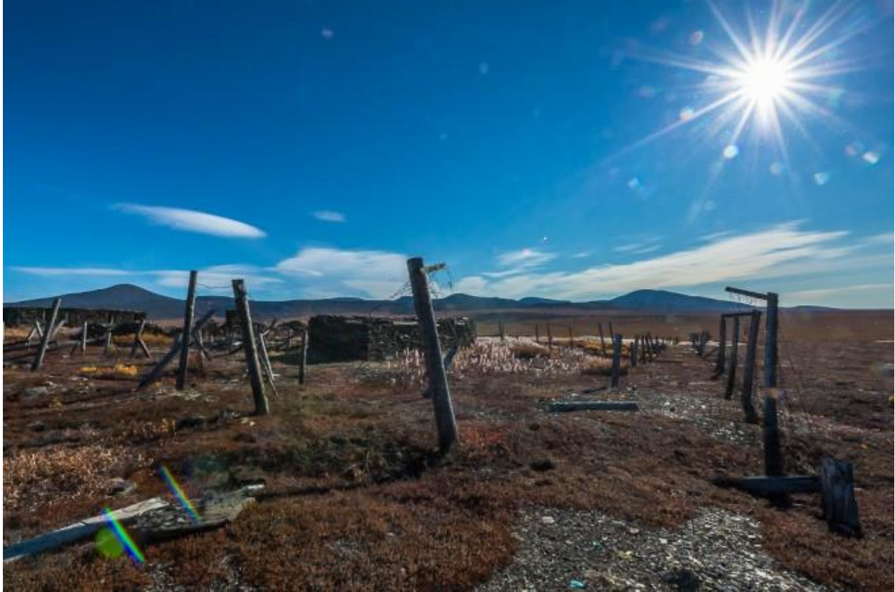
Լքված կալանավայր Մազադանում