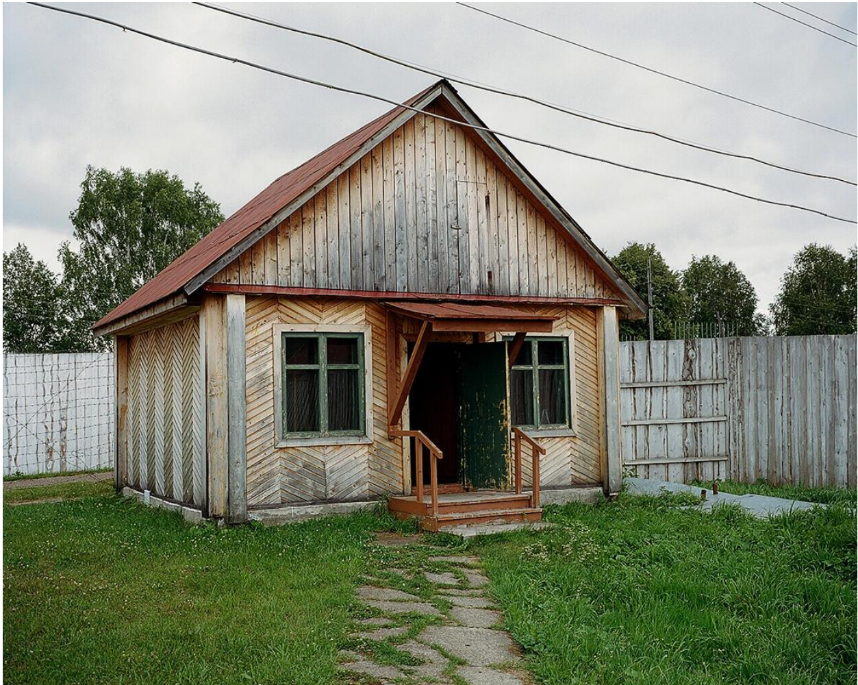
Շնոնտլովկա 36-րդ կալանավայրում (վերանորոգված)

Հերթով կարդում էին կալանավորների անուններն ու բաց թողնում: Երբ հասան իմ անվանը, հանձնարարեցին, որ դուրս գամ շարքից ու սպասեմ: Բոլորին աշխատանքային հատված ուղարկելուց հետո ինձ հանձնարարեցին հավաքել իրերս ու սպասել հրահանգների: Արդեն պարզ էր, որ վերջին օրս է կալանավայրում: