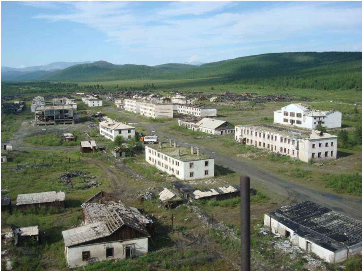
Աքրտրավայրս այսօր՝ ավան-ուրվական:

Վաղիմ անունով մոսկվացի մեկը, որը հերթափոխի պետ էր, նոր տարվա տոնակատարությունների ազդեցության տակ խոստովանեց, որ համաձայնել է իմ մասին տեղեկություններ փոխանցել նրանց: Ե՛ւ նրան, ե՛ւ այլոց, որոնք ինձ խոստովանել են սրա մասին, ոչինչ չեմ ասել: Նույնիսկ՝ այլևս նման բան չանելու խորհուրդ չեմ տվել: Չեմ էլ փորձել նրանց խոստովանությունը հոգուտ ինձ օգտագործել: Լսել ու լռել եմ: Թողել եմ, որ իրենք որոշեն: Նաեւ՝ հարաբերություններս չեմ խզել նրանց հետ: Մի օր Վաղիմը որոշում է զանգահարել ՊԱԿ-ի այդ նույն երիտասարդ աշխատակցին եւ տեղեկացնել, որ իրենից այլևս մատնագրեր չսպասի: Չեկիստը Վաղիմին խնդրում է հապշտապ վճիռներ չկայացնել եւ խոստանում է մի քանի ժամից լինել Բուրկանդիայում ու անձամբ գրուցել նրա հետ: Դեպի Բուրկանդիա ճանապարհին նրանց ավտոմեքենան ձորն էր գլորվել, իսկ ՊԱԿ-ի երիտասարդ աշխատակիցը մահացել էր: