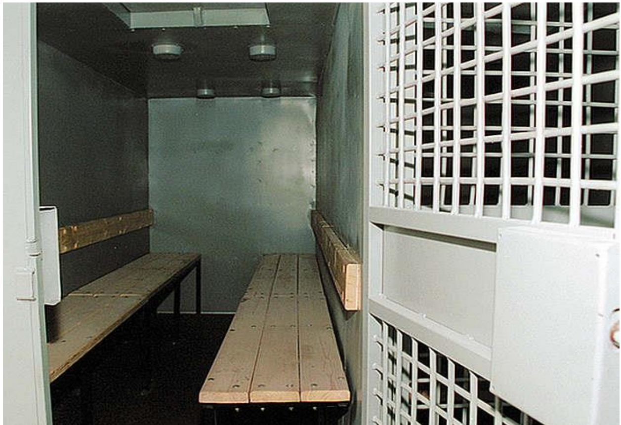
Կալանավորներ տեղափոխող ավտոմեքենայի ընդհանուր բեռնախուցը